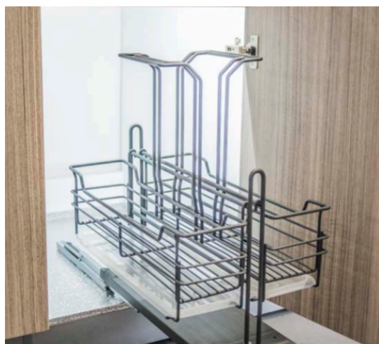
CANASTILLA 300MM (E201366)