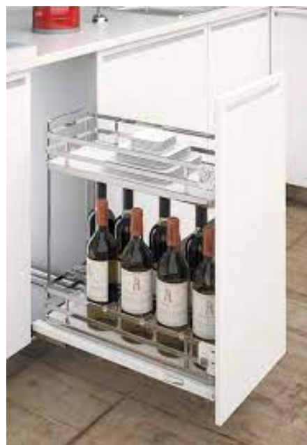
EXTRAIBLE C/PORTABOTELLAS P/MELAMINICO 300MM CR IZQ GUIA OCULTA (E201323)