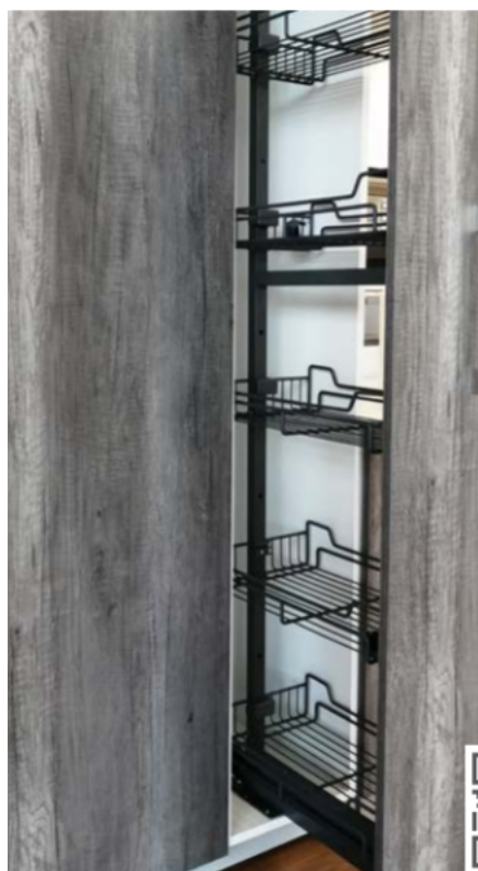
DESPENSA 300MM GRAFITO 5 NIV 2 MT (E201358)