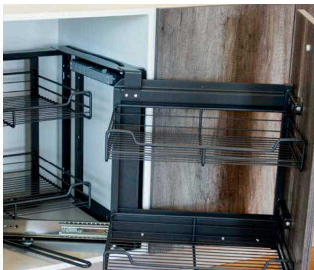
ESQ MAGICA DER GRAFITO (E201357) ESQ MAGICA IZQ GRAFITO (E201356)