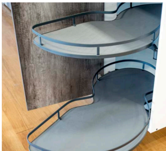
EXTR TIPO PERA GRAFITO IZQ