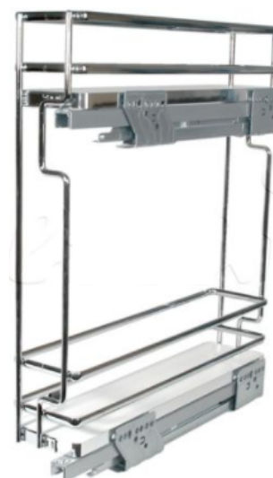
BOTELLERO PISO BCO