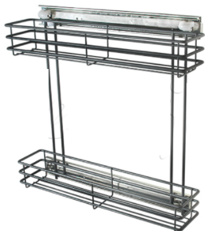
BOTELLERO GRAFITO 150MM